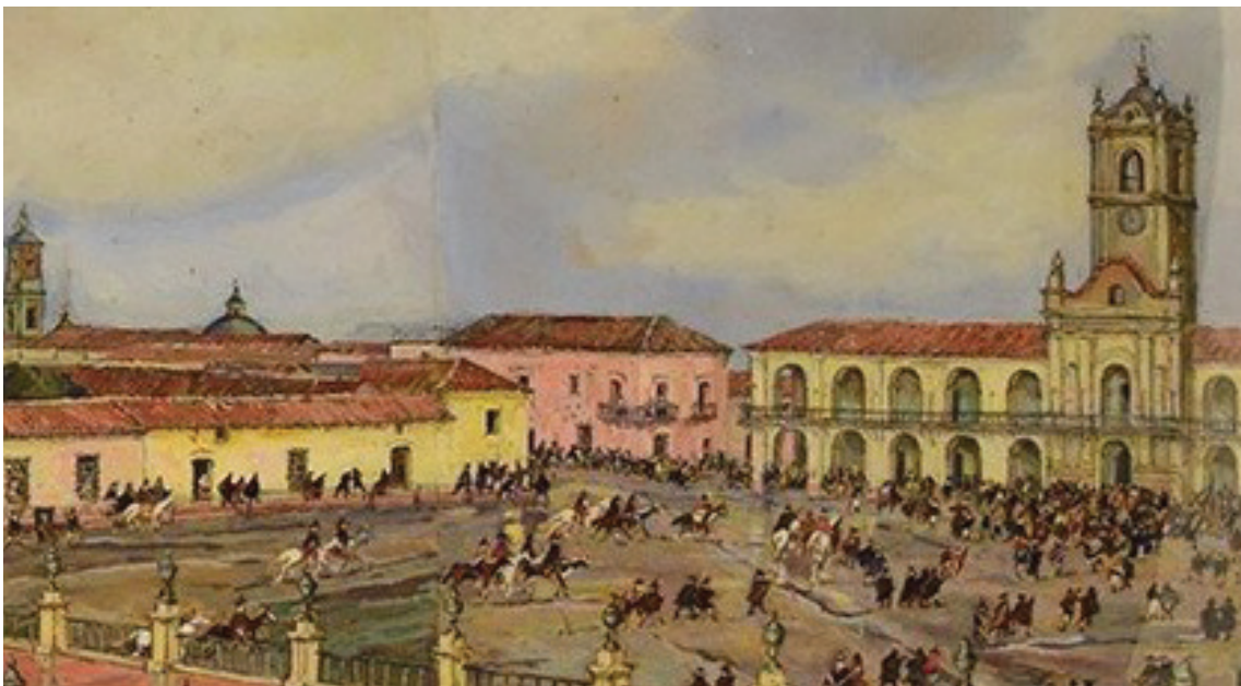
"25 de mayo de 1810" , de Léonie Matthis. FRAGMENTO 2