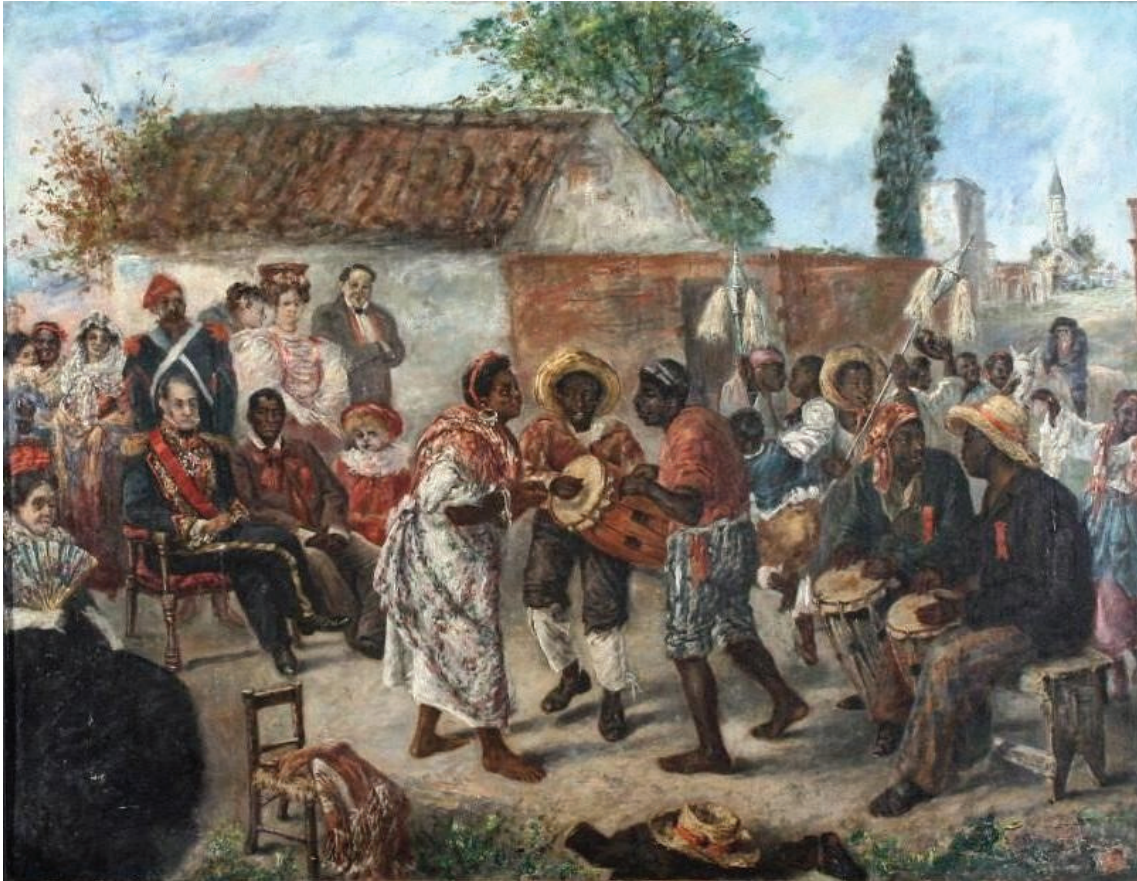
"El candombe federal" , de Martín Boneo, 1845. Detalle.