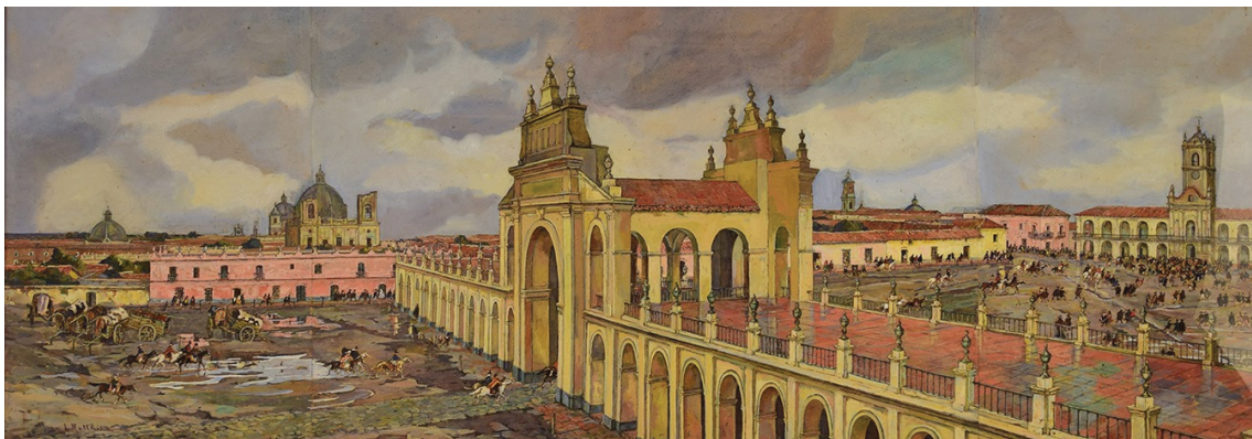
“25 de mayo de 1810”, de Léonie Matthis, Museo Nacional del Cabildo y la Revolución de Mayo.

Esta pintura de Léonie Matthis representa la movilización de la población a la Plaza de la Victoria, frente al Cabildo para apoyar la Revolución.