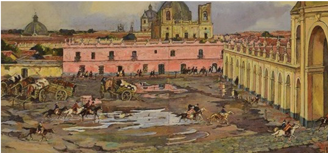
"25 de mayo de 1810" , de Léonie Matthis. FRAGMENTO 1

En los siguientes dos fragmentos de la pintura de Matthis podés ver a mujeres y hombres vestidos y vestidos con ponchos, una vestimenta típica de los sectores populares, dirigiéndose al Cabildo.