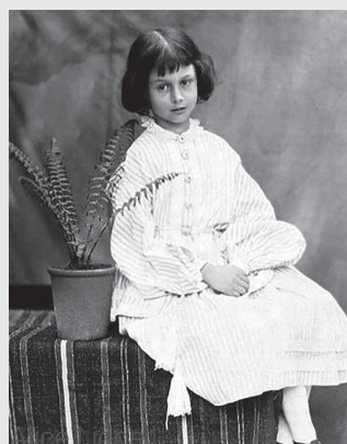
Fotografía de Lewis Carroll (1860)

(Testimonio de Alice Liddell recogido por Collingwood)