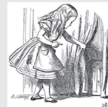
Ilustración de John Tenniel (1865), tomada de Wikimedia Commons.

El primer ilustrador de Alicia fue John Tenniel (1820-1914). Recibió instrucciones precisas del autor para que las ilustraciones reflejaran el mundo de la obra tal y como él lo imaginaba.