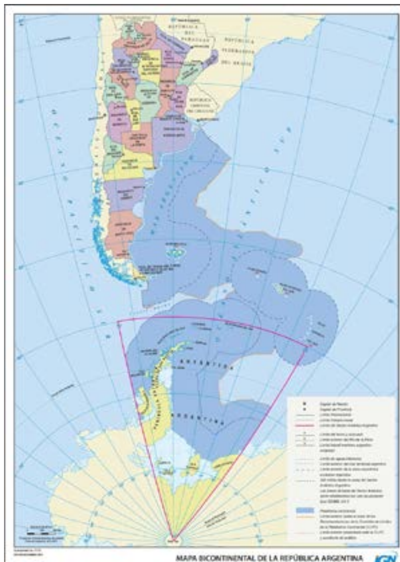
Mapa Bicontinental de la República Argentina.

El mapa que van a ver a continuación no es tan conocido como otros de la Argentina. Representa cómo es todo el territorio del sur de nuestro país: