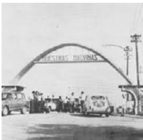
Foto que forma parte del trabajo presentado por el ISFD 35 de Monte Grande: “Malvinas y nuestros barrios”. Realizado por Julián Gauna, Cecilia Sosa y la docente Rebeca Zalazar.