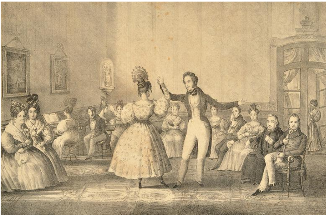
Minuet , Charles Pellegrini, 1831.

Algunas preguntas posibles para guiar la observación y el intercambio colectivo sobre las obras, en relación con los contenidos a enseñar: