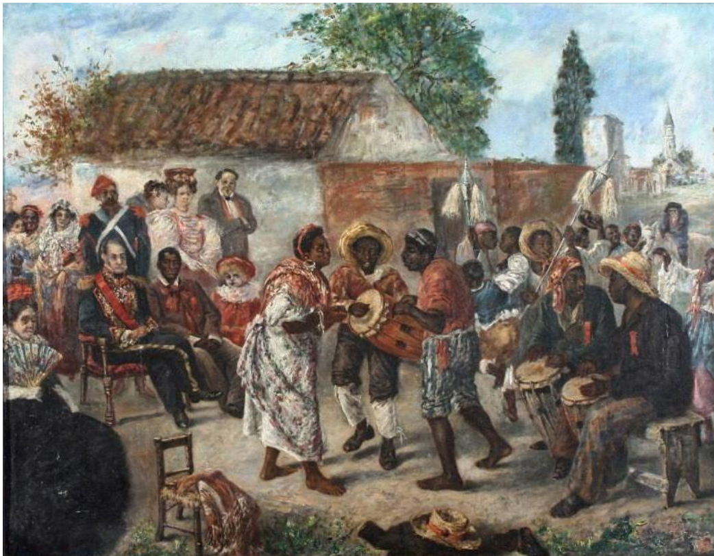
El candombe federal , Martín Boneo, 1845. (Fragmento)

pintura para saber más sobre los candombes.