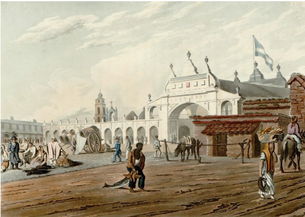
El mercado , de Emeric Essex Vidal (1820).

En la obra de Emeric Vidal se ve la Recova Vieja, una construcción con muchos arcos que atravesaba la plaza principal y la dividía en dos: la Plaza de la Victoria y la Plaza del Fuerte (estas dos plazas forman hoy la Plaza de Mayo). En la Recova había comercios que vendían alimentos (pescados, hortalizas, frutas, panes, huevos), escobas, velas o telas.