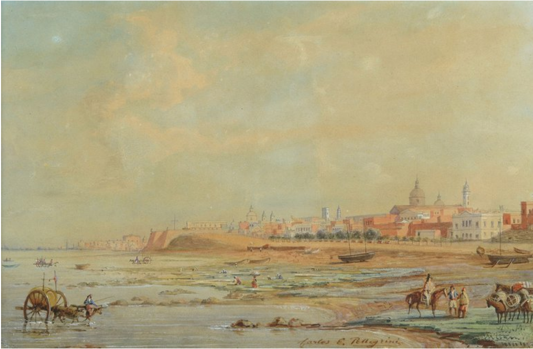
Vista de Buenos Aires , Charles Pellegrini, 1834.

1828 y se quedó a vivir. Realizó sus primeras pinturas para mostrar a su familia la ciudad a la que había llegado. Con el tiempo la pintura se convirtió en su actividad principal y sus obras permiten conocer cómo era la ciudad por aquellos tiempos.