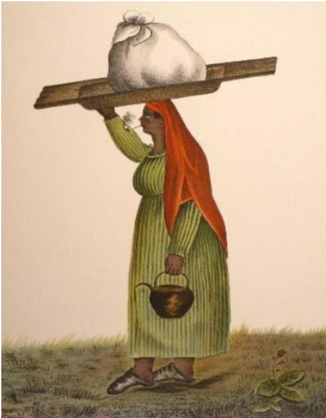
La lavandera , César H. Bacle.