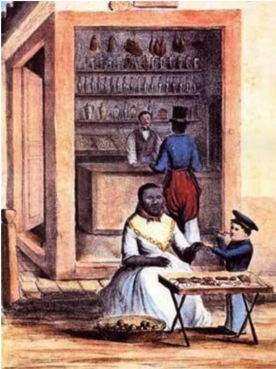
Pulpería en la ciudad en la ciudad de Buenos Aires. Alberico Ísola (1844).

En el trabajo colectivo, sugerimos nuevamente detenerse en cada una de las imágenes para enriquecer las interpretaciones.